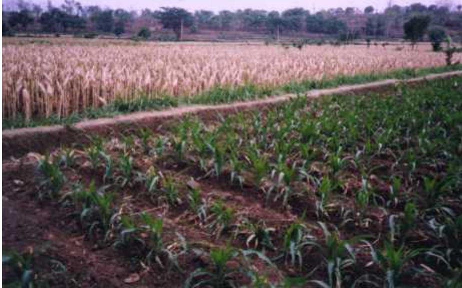
Gambar 1. Tanaman Jagung